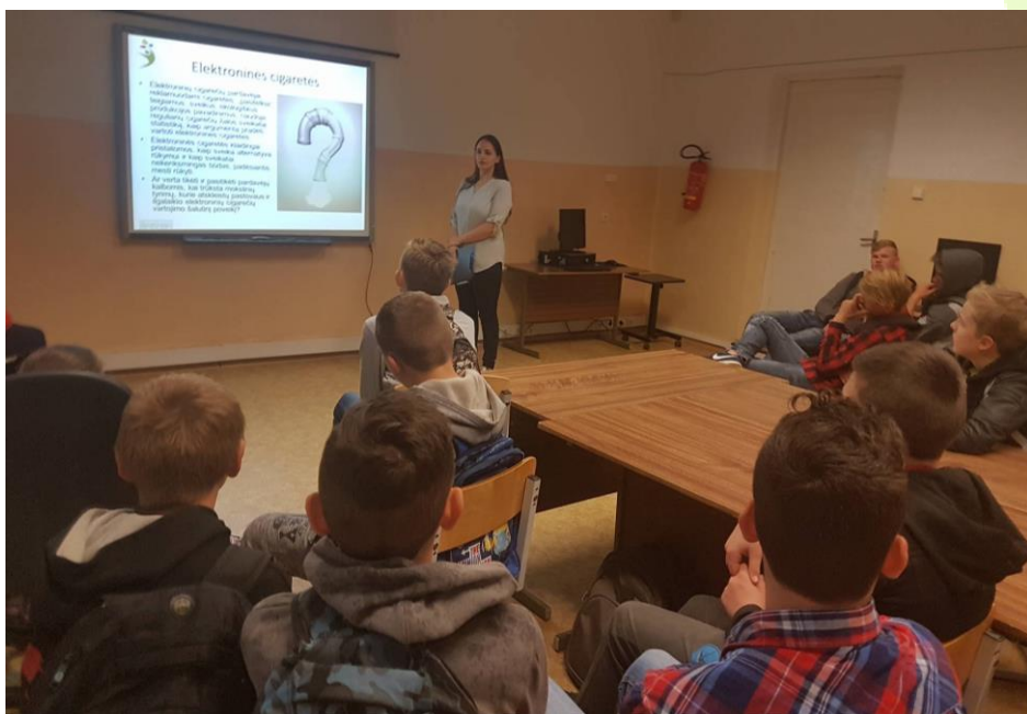
Jurbarko r. Raudonės pagrindinė mokykla