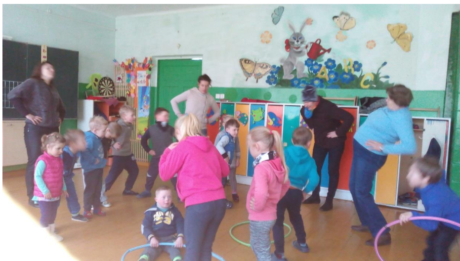
Jurbarko r. Eržvilko gimnazija, Varlaukio skyrius ↑