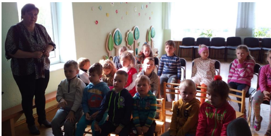
Jurbarko r. Veliunos A. ir J. Juškų gimnazija