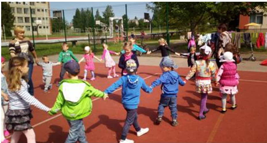
Jurbarko r. Veliunos A. ir J. Juškų gimnazija

Kiekviena mūsų diena turi būti pilna judėjimo džiaugsmo. Vaikams judėjimas yra neišsenkanti savirealizacijos ir supančio pasaulio pažinimo priemonė. Fizinė veikla vaikai realizuoja svarbiausius savo poreikius – judėjimo, pažintinius, veikimo, bendravimo, saviraiškos, atskleidžia savo fizinės išgales bei gebėjimus. Dėl fizinio aktyvumo poveikio padidėja širdies susitraukimų dažnis, tankėja kvėpavimas, suaktyvėja kraujotaka ir vyksta kai kurie kiti fiziologiniai organizmo pokyčiai.