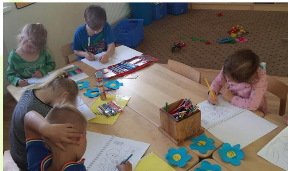
Jurbarko r. Seredžiaus Stasio Šimkaus mokykla-daugiafunkcis centras