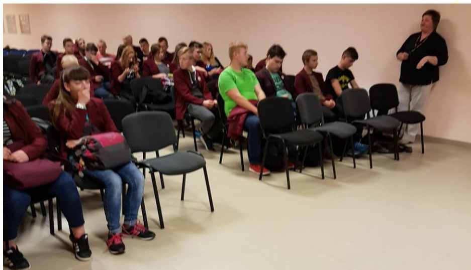
Jurbarko r. Veliunos A. ir J. Juškų gimnazija